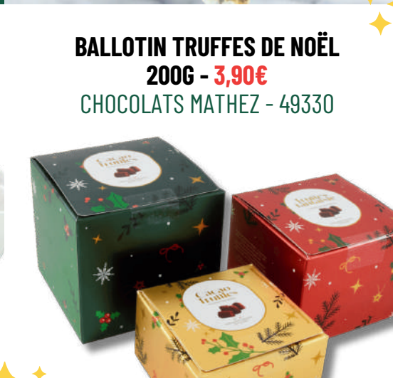
BALLOTIN TRUFFES DE NOËL 200G - 3,90€ CHOCOLATS MATHEZ - 49330