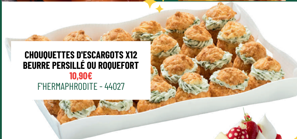
CHOUQUETTES D'ESCARGOTS X12 BEURRE PERSILLÉ OU ROQUEFORT 10,90€ F'HERMAPHRODITE - 44027