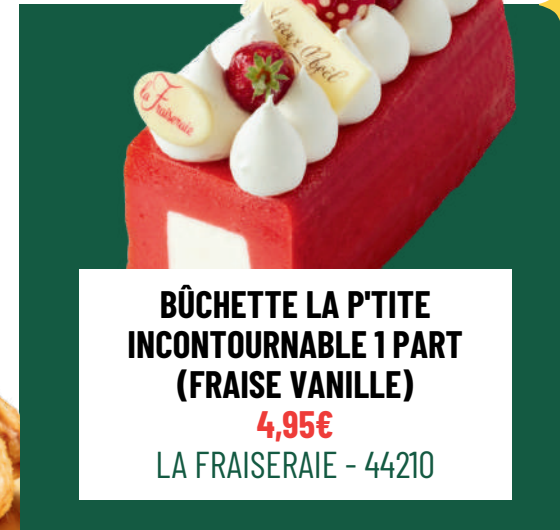
BÛCHETTE LA P'TITE INCONTOURNABLE 1 PART (FRAISE VANILLE) 4,95€ LA FRAISERAIE - 44210