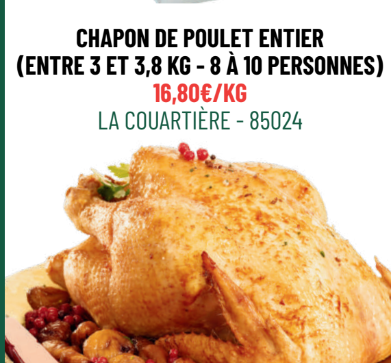
CHAPON DE POULET ENTIER (ENTRE 3 ET 3,8 KG - 8 À 10 PERSONNES) 16,80€/KG LA COUARTIÈRE - 85024