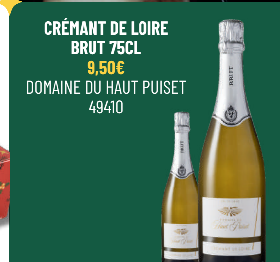
CRÉMANT DE LOIRE BRUT 75CL 9,50€ DOMAINE DU HAUT PUISET 49410