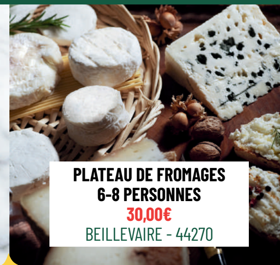
PLATEAU DE FROMAGES 6-8 PERSONNES 30,00€ BEILLEVAIRE - 44270