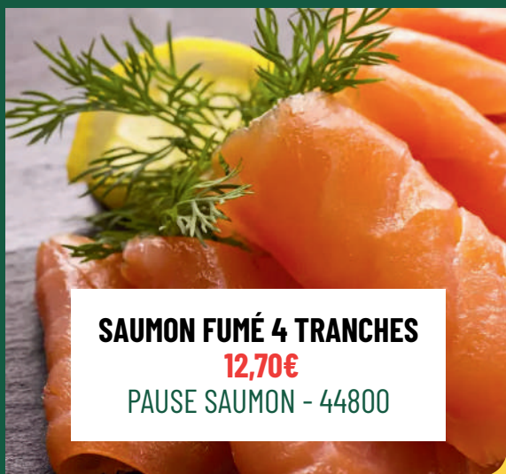
SAUMON FUMÉ 4 TRANCHES 12,70€ PAUSE SAUMON - 44800