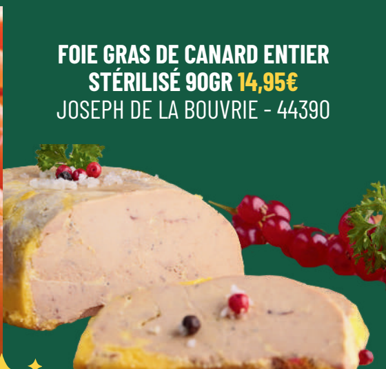
FOIE GRAS DE CANARD ENTIER STÉRILISÉ 90GR 14,95€ JOSEPH DE LA BOUVRIE - 44390